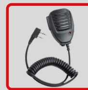
ไมค์หูฟัง ชนิดรีโมท