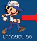
มาด้วยตนเอง