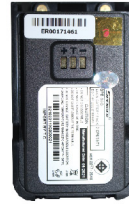
BATTERY 2100 mAh.