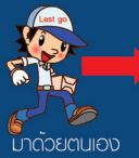
มาด้วยตนเอง