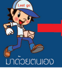
มาด้วยตนเอง

พบเห็นรถของหน่วย บริการลูกค้าสัมพันธ์ แจ้งความประสงค์พาสินค้าได้ทันที