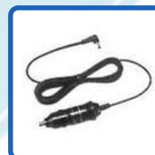
Cigar-Plug Cable (EDC-43)