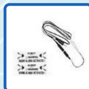
Alarm/Extension Cable Kit (ADALM135)