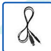
PC Programming Cables: USB Port (ERW-7)

คุณลักษณะเฉพาะอาจมีการเปลี่ยนแปลงได้โดยไม่ต้องแจ้งให้ทราบล่วงหน้า สิ้นค้าออกแบบมาเพื่อให้ใช้งานโดยผู้ที่ทราบวิธีใช้งานอย่างถูกต้อง