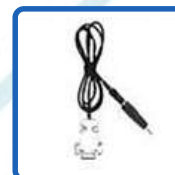
PC Programming Cables: Serial Port (ERW-4C)