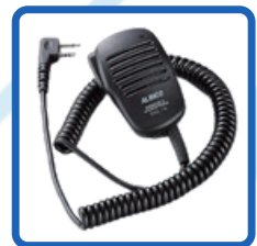
Speaker Microphone (EMS-76)