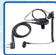
Earphone Microphone (EME-56A)