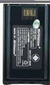
Battery 1200 mAh.