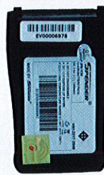
Battery 1200 mAh.