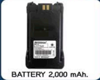
BATTERY 2,000 mAh.