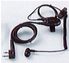
Earphone Microphone (EME-56A)