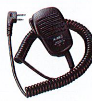
Speaker Microphone (EMS-76)