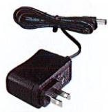
AC adapter / Switching 120V (EDC-191T)