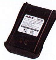
Li-ion Battery Pack DC 7.4V 1800mAh (EBP-92) Belt clip not included.

Alinco and ALINCO logo are registered trademarks of Alinco Inco