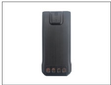
แบตเตอรี่ 1500mAh