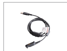
สายโปรแกรม PC155