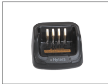
เครื่องชาร์จเร็ว MUC