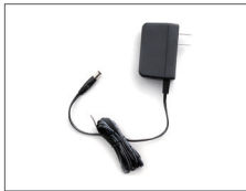
อะแดปเตอร์