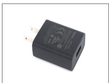
อะแดปเตอร์ (USB)