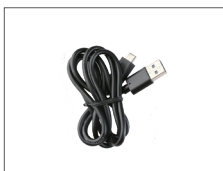
สายตาดำ PC 143