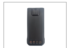
แบตเตอรี่ 2000mAh BL2021