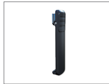
คลิปหนีบเข็มขัด