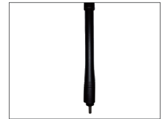
สายอากาศ